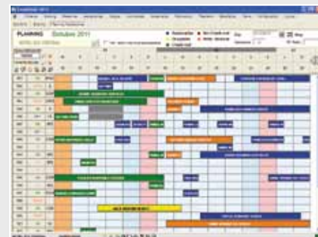
Pantalla de Planning