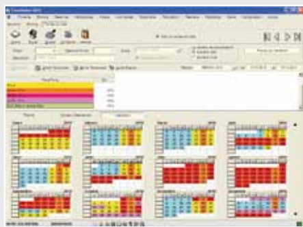
Pantalla de Tarifas del Hotel