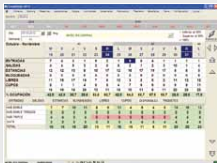
Pantalla de Booking