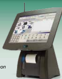
Terminal táctil ICG con impresora integrada