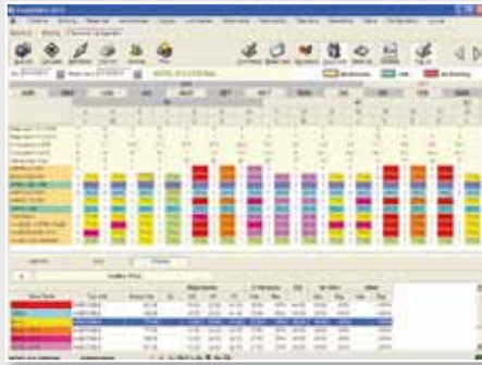
Pantalla de Revenue Management